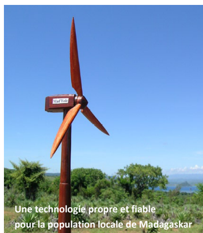
Une technologie propre et fiable pour la population locale de Madagascar

myclimate s'engage concrètement pour la protection du climat en soutenant des projets visant à réduire directement les gaz à effet de serre. Cet objectif est atteint en remplaçant par exemple les énergies fossiles par des énergies renouvelables, en favorisant les économies d'énergie ou en introduisant des technologies plus efficaces.